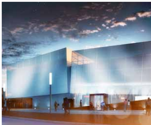
▲ Le futur théâtre de l'Arsenal - Maître d'œuvre : Jean-François Bodin