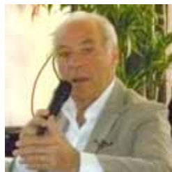
Jean-Jacques Dry Architecte