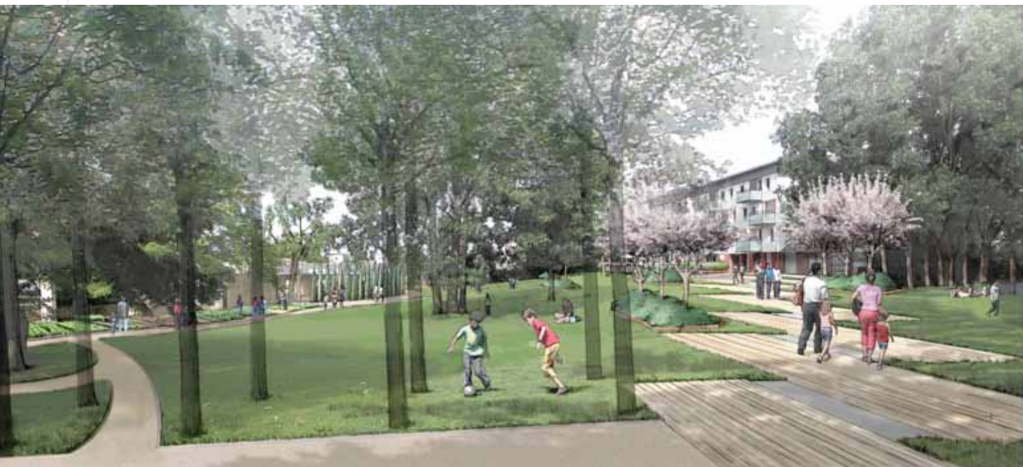
▲ Le parc des Cerfs-Volants - Maîtres d'œuvre : MAP & AEP Normand

Gérard Thurnauer ► Je suis un fanatique du bouclage spatial : j'aime avoir deux voies possibles pour me rendre d'un point à un autre. Au départ, le Germe et Val-de-Reuil étaient un réseau qui se bouclait. Imaginer une seule voie principale (la route des Falaises) est une erreur car on ne crée pas de la profondeur urbaine. Ce qui est vrai pour la circulation automobile l'est aussi pour les piétons. La rue Grande ne peut pas être le seul axe porteur d'une vérité. Il faut créer des liens entre la rue Grande et un au-delà.