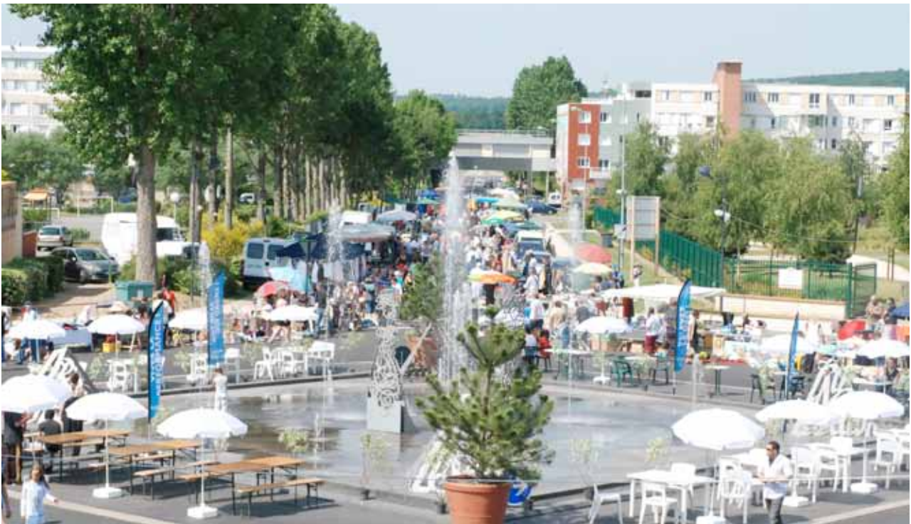
▲ Brocante autour de la fontaine des Droits de l'Homme