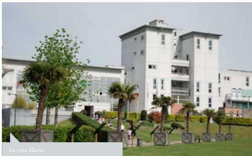
La zone Mairie

Nous avons recherché comment combiner les réseaux piétons et espaces verts et comment mettre les voitures en dessous pour éviter la marée automobile aux pieds des immeubles.