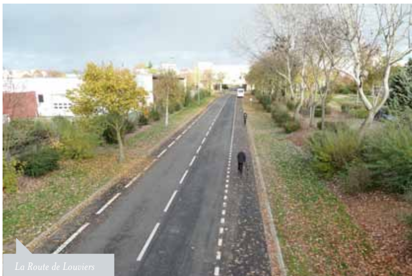
La Route de Louviers

Dans les autres villes nouvelles, au nom d'un futur que l'on ne maîtrise pas, on construit dans un espace extrêmement vaste des parties de ville qui auront un sens quand tout sera terminé. C'est jouer avec le temps des gens. Et cela ne nous semble pas très démocratique d'imposer une forme de ville aux futurs élus. On se dit : si l'on ne peut pas faire une grande ville, faisons un Germe de ville. Comme un enfant : vivable à toutes les étapes de sa vie.