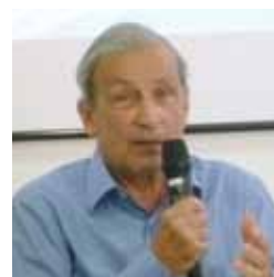
Alain Sallez Économiste, professeur à l'Essec et aux Ecoles de la Rénovation Urbaine et de la Gestion des Quartiers