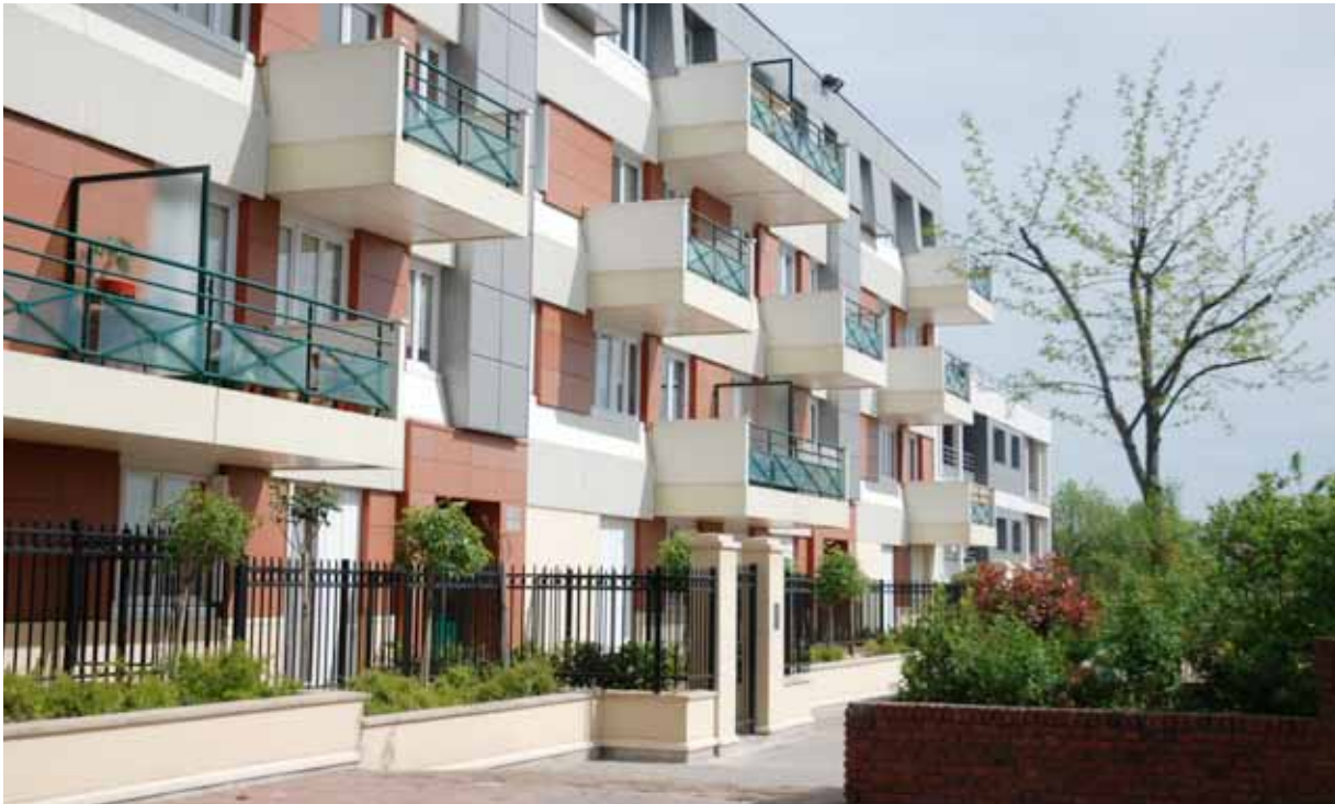
▲ Logements réhabilités rue du Pas-des-Heures