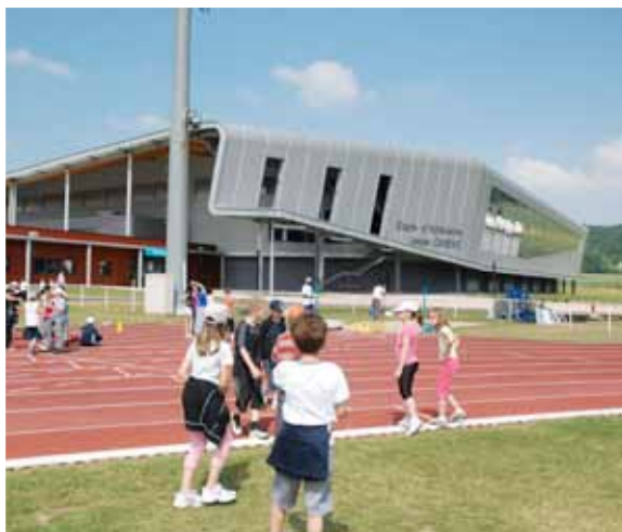
▲ Stade d'athlétisme Jesse Owens

Pour la suite, l'ANRU a identifié treize sites pouvant bénéficier des Plans stratégiques locaux. Dix sont prêts et Val-de-Reuil est l'un des trois qui vont démarrer cette année.