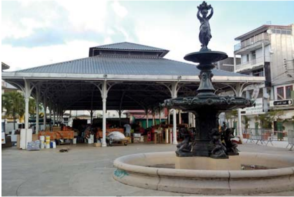
Le marché aux épices de Pointe-à-Pitre

Taux de chômage moyen de 30 % avec des pics à 50 % sur certains quartiers, et un fort dépeuplement (nombre d'habitants passé de 26 000 à 17 500) : « Le territoire de Pointe-à-Pitre part de très loin, les problèmes y sont importants, et les trois communes qui forment le bassin de population étaient totalement désolidarisées, voire en concurrence », résume Ghislain Lueza, directeur général du cabinet CODE. « Heureusement, les choses évoluent concrètement. Deux communes se sont notamment associées dans une intercommunalité. »